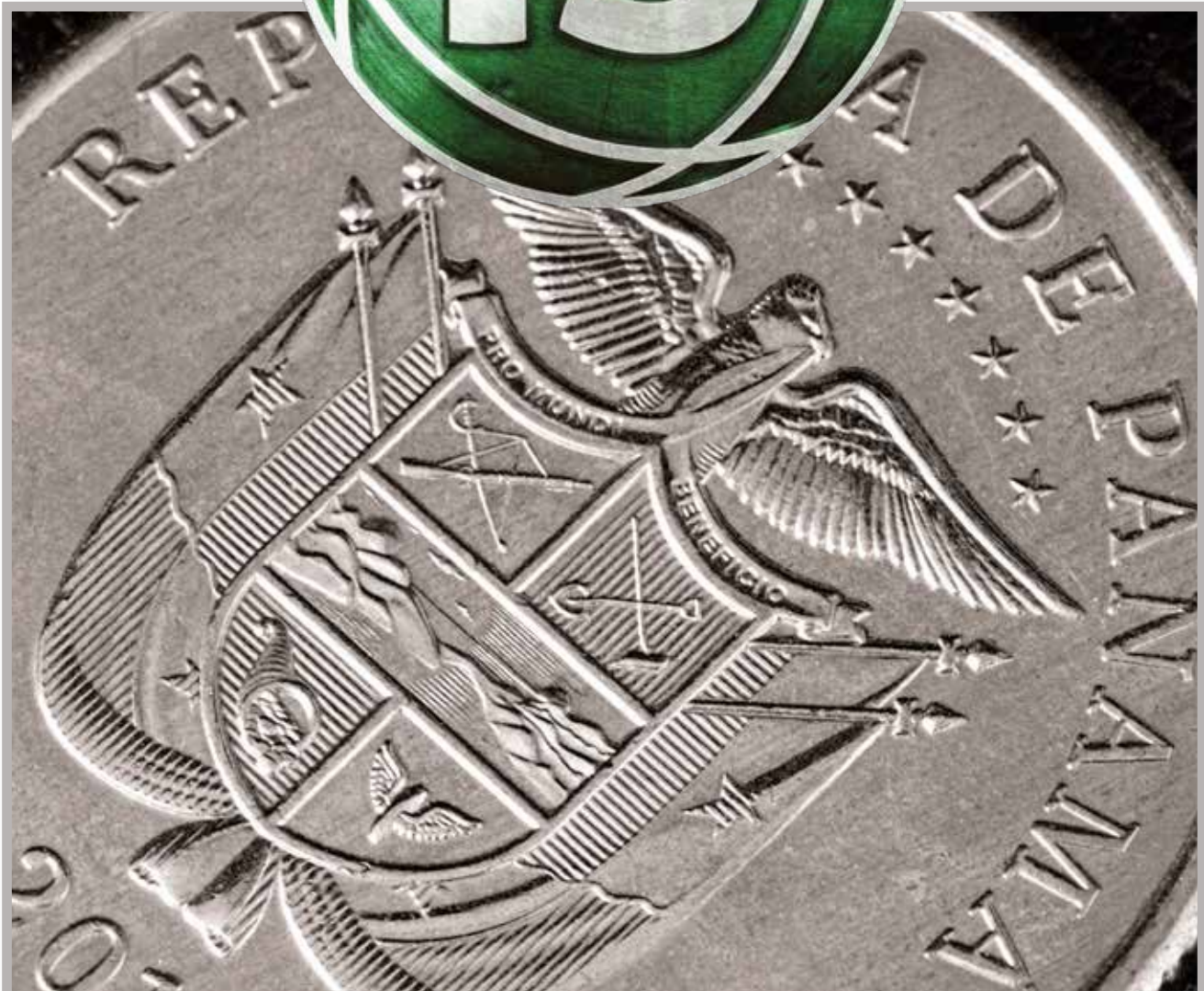
EL BALBOA. Moneda oficial de Panamá desde 1903 cuando se declaró la República Oficial de Panamá.